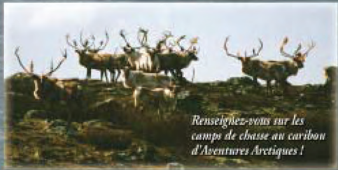
Renseignez-vous sur les camps de chasse au caribou d'Aventures Arctiques !

Vous venez en vol direct de Montréal à bord d'un jet commercial de West Air à destination de Kuujuaq d'où vous monterez à bord d'un Twin Otter qui vous emmènera soit vers la rivière Payne ou vers Tunulik II, là où débute votre Aventure Arctique.